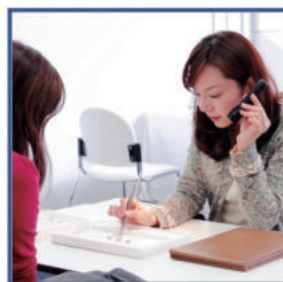
④石を選んで 出来上がりをイメージ