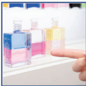
②ジュエリーボトル 決定！