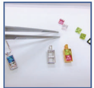
⑤オーダーすると約40日 かけて職人が手作り