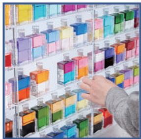
①ボトルを選んで コンサルテーション

特別な「意味」を込めることができるオーラソーマジュエリーは、他のジュエリーとは全く違う魅力があります。