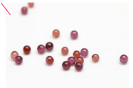
エナジャイジング ガーネット